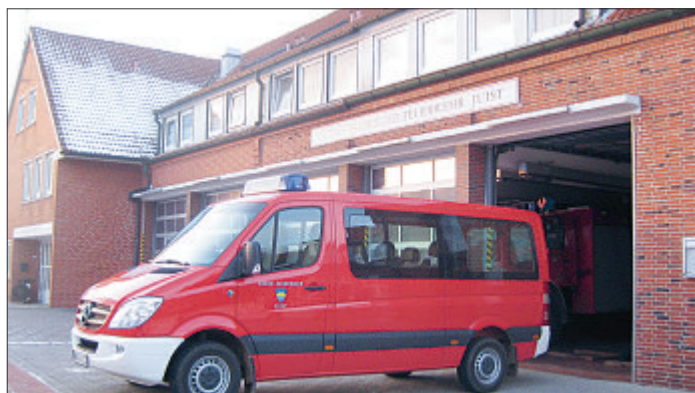
Die fünf Fahrzeuge der Feuerwehr sind im alten Feuerwehr-Gerätehaus sehr beengt untergebracht.

Für die Einrichtung einer Kinderkrippe sei der Kindergarten zu klein, und im Übrigen fehlten Betreuungsmöglichkeiten gerade für die Grundschüler auf der Insel, begründete Heike Braun ihren Antrag. Das wäre für alleinerziehende Mütter, zu denen sie auch gehört, ein Riesenproblem. „Wir haben einen Arbeitsplatz, aber keine Kinderbetreuung“, bedauerte sie. Auch ihr Versuch, eine Tagesmutter auf der Insel zu