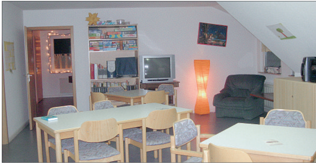
In diesem Raum der Arbeiterwohlfahrt im Dorfgemeinschaftshaus wird heute zum ersten Mal der Familientreff in einer lockeren Café-Atmosphäre angeboten.

ERÖFFNUNG Lockere Café-Atmosphäre geschaffen – Hilfe bei Erziehungsproblemen