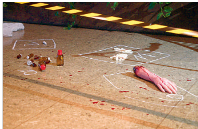
Einiges Blut floss auch in diesem Jahr wieder beim „Tatort Töwerland“ – zum Glück nicht wirklich.

zu vier Autoren pro Jahr 14 Tage auf Juist leben und arbeiten dürfen. „Ohne das Zusammentreffen von Jan Zweyer,